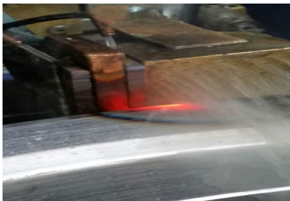
Foto 1. Speciale geometrie harden